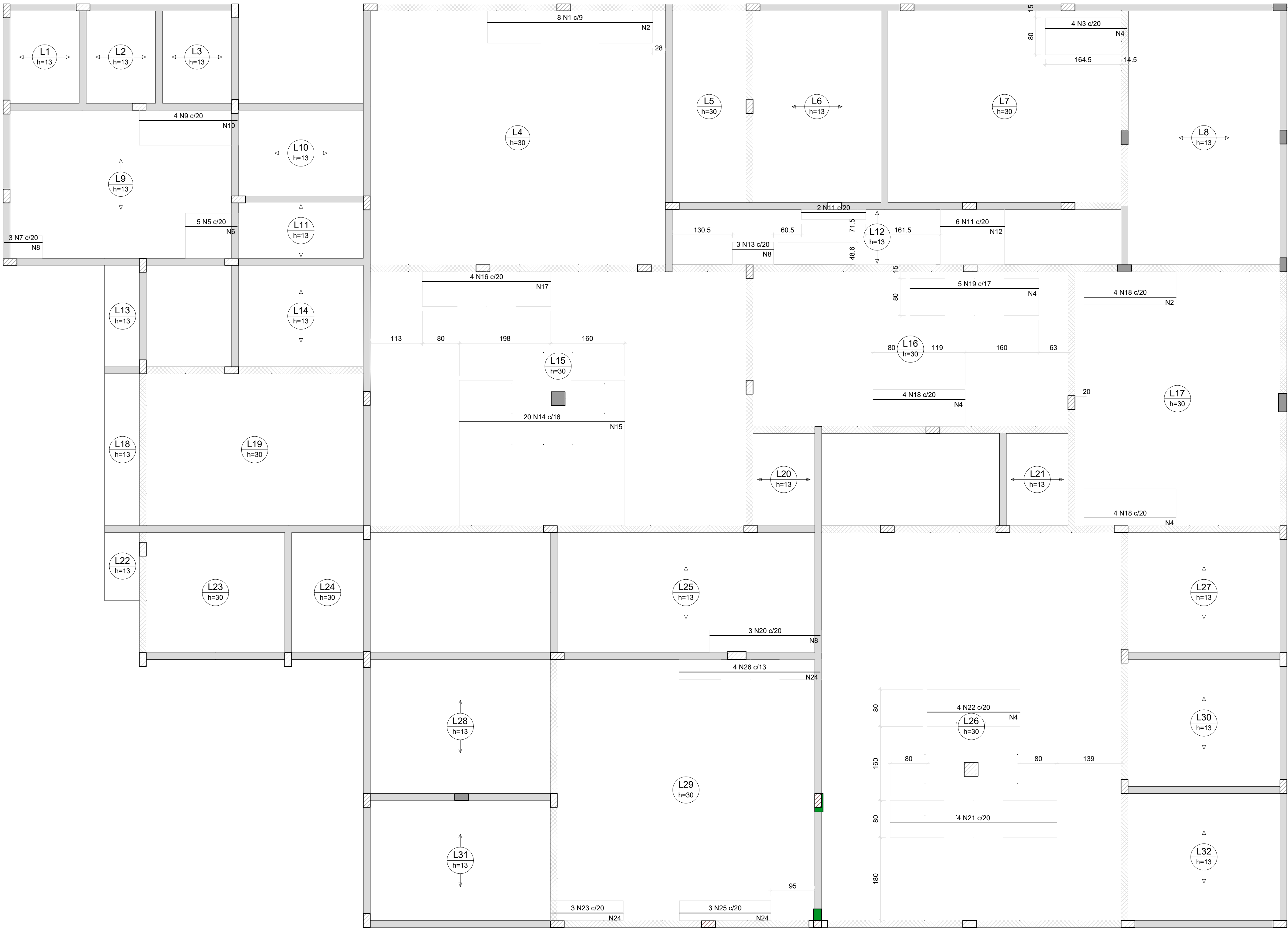
Armação negativa das lajes do pavimento 1º pavimento (Eixo X)